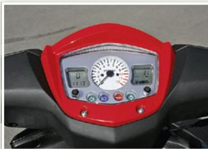
Auch der Bullet 50 verfügt über alle notwendigen Anzeigen, allerdings wirkt das Cockpit des Speedfight hochwertiger.

Sportscooter sind nach wie vor „in“. Der Erfolg des Peugeot Speedfight, der inzwischen in der dritten Modellgeneration an den Markt geht, beweist diese These. Doch auch die Konkurrenz schläft nicht. Hersteller aus China, Taiwan, Japan oder auch Italien haben die 50er Sportscooter schon lange als attraktives Marktsegment erkannt. Mit dem TGB Bullet 50 ist ein weiteres Fahrzeug dieser Gattung 2009 neu an den Markt gekommen.