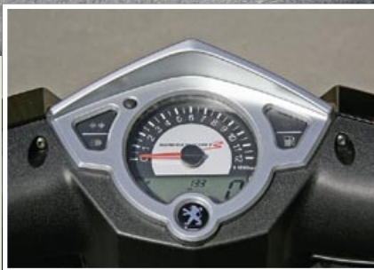
Der Speedfight 3 verfügt über ein voll ausgestattetes, gut ablesbares Cockpit.

► Sportscooter aller Couleur erfreuen sich großer Beliebtheit. Wir haben den brandneuen Speedfight 3 und den Bullet 50 auf Herz und Nieren geprüft.