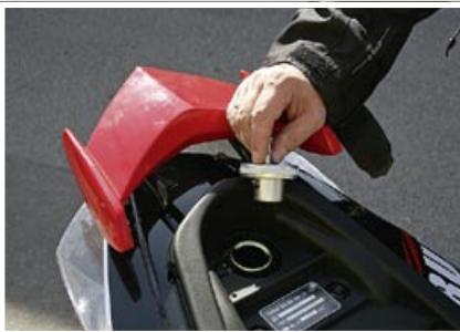
Beim Bullet muss die hakelige Sitzbank zum Tanken hochgeklappt werden.

beschleunigt ihn äußerst fix auf Höchstgeschwindigkeit. Beim Speedfight ist die Gasannahme nicht ganz so prompt wie beim Bullet, dann jedoch zieht auch der Speedfight davon. Beim Fahrverhalten hat der Franzose dagegen wieder leicht die Nase vorne. Spielerisch leicht lässt sich der Speedfight um die Kurven steuern, ohne dass man jemals das Gefühl hätte, dass die Stabilität in Frage gestellt wäre. Das trifft zwar auch auf den Bullet zu, allerdings nicht ganz im gleichen Maße wie beim Speedfight. Während man beim Speedfight auf