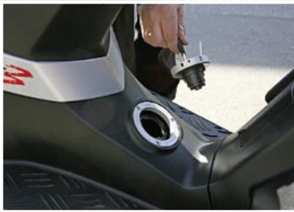
Mitgedacht: Beim Speedfight ist Tanken ohne große Fummelei möglich.