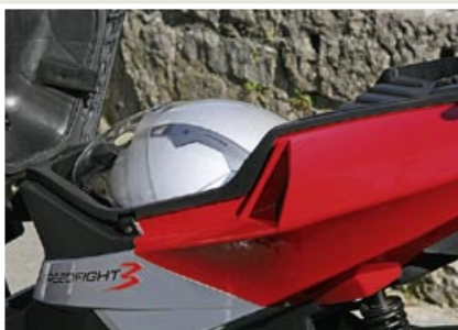
Keine großen Unterschiede gibt es beim Stauraum. Beide Roller schlucken einen Jethelm.

beschleunigt ihn äußerst fix auf Höchstgeschwindigkeit. Beim Speedfight ist die Gasannahme nicht ganz so prompt wie beim Bullet, dann jedoch zieht auch der Speedfight davon. Beim Fahrverhalten hat der Franzose dagegen wieder leicht die Nase vorne. Spielerisch leicht lässt sich der Speedfight um die Kurven steuern, ohne dass man jemals das Gefühl hätte, dass die Stabilität in Frage gestellt wäre. Das trifft zwar auch auf den Bullet zu, allerdings nicht ganz im gleichen Maße wie beim Speedfight. Während man beim Speedfight auf